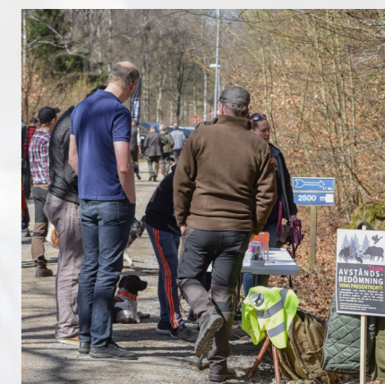
Avståndsbedömning med Järlövs Skjutskola och Jaktsskyttebana och ett fint pris att vinna lockade många besökare.